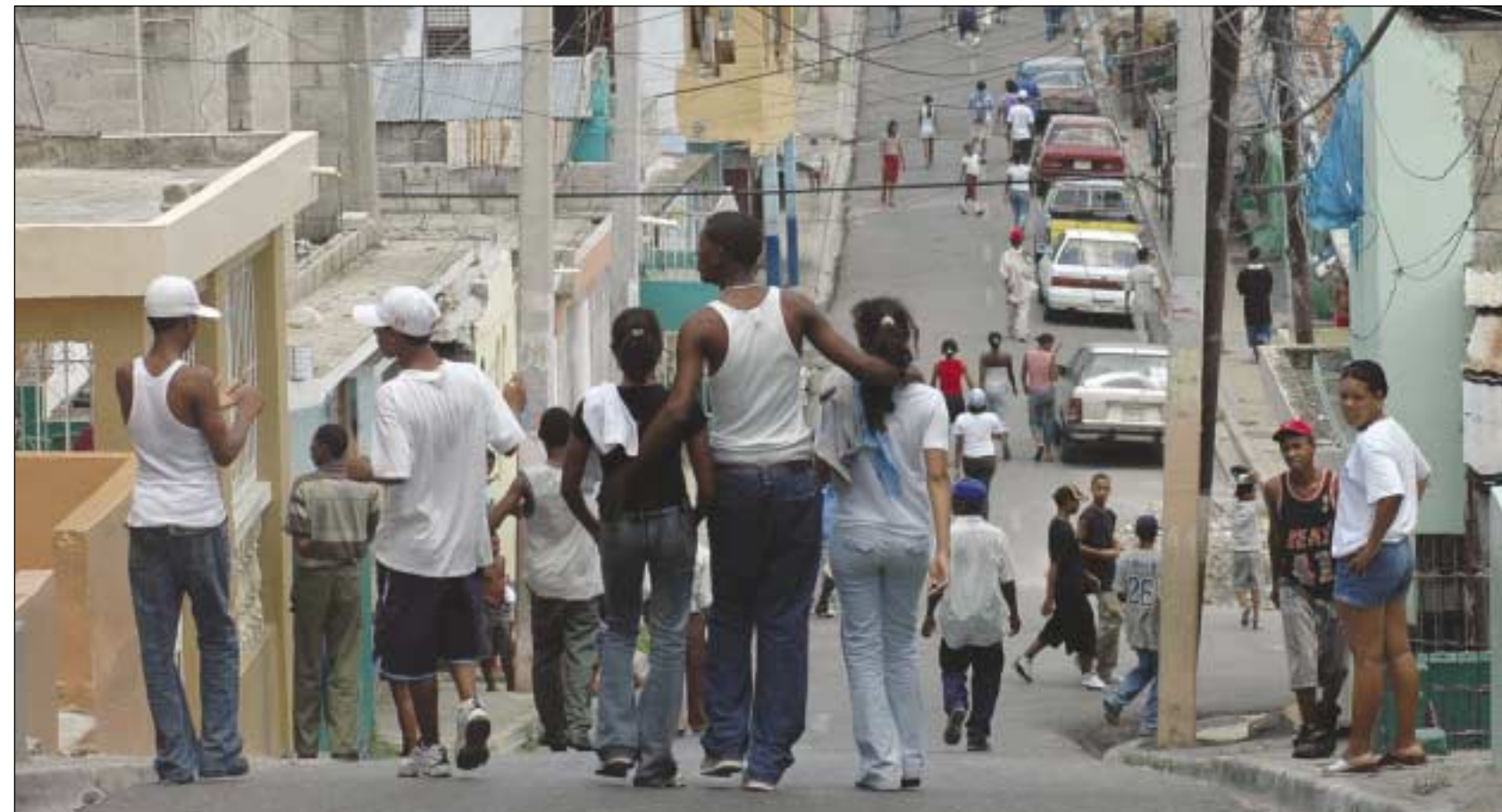
GUALEY ES UNO DE LOS 66 BARRIOS DEL DISTRITO NACIONAL. EN LA ACTUALIDAD SE ESTIMA QUE RESIDEN 17,069 PERSONAS Y PARA 2006 TENDRÁ 17,312 HABITANTES.