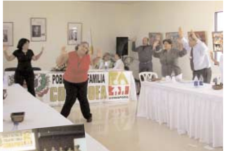
En las provincias de Salcedo, Duarte y Samaná, CONAPOFA hizo las jornadas de sensibilización para abordar temas de población, familia y desarrollo que permitan el desarrollo local.

Las provincias María Trinidad Sánchez, Duarte, Samaná y Salcedo fueron sensibilizadas por el programa de CONAPOFA que busca impulsar "Municipios en Desarrollo", y que cuenta con el auspicio del Programa de Reforzamiento del Sistema de Salud (PROSISA), desde el 19 de marzo. "Les esta-