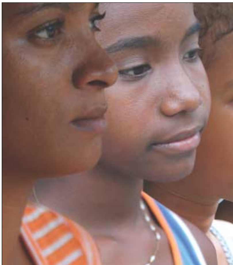
EL REGISTRO CIVIL COMPILA LOS NACIMIENTOS Y DEFUNCIONES DE UNA NA- CIÓN,

Los documentos de registro eclesiástico aparecieron primero en Francia, España, Inglaterra e Irlanda que fueron los primeros países que adoptaron un sistema de registro civil. Con relación al continente americano, al fundarse la colonia de la Bahía de Massachussets (1639), se dispuso del registro civil de nacimien-