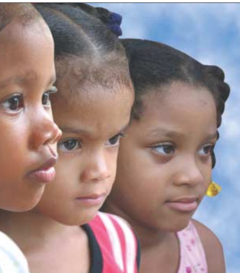
AMBOS SON HECHOS VITALES QUE IMPACTAN EN LOS ESTUDIOS SOCIODEMOGRÁFICOS.

responsables a la evolución de los servicios del registro civil de República Dominicana en las etapas: colonial, de la invasión haitiana, de la independencia, de la anexión a España, moderno, contemporáneo y actual.